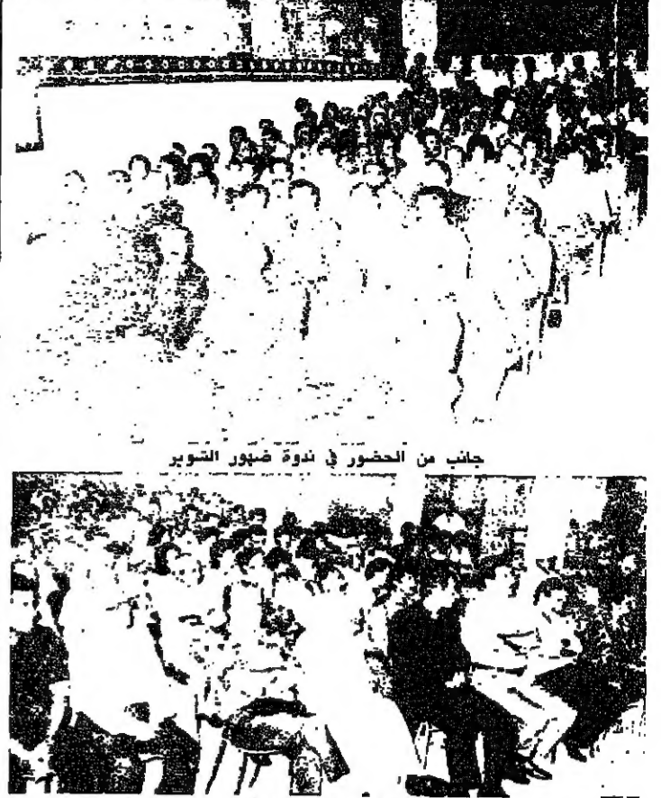
جانب من الحضور في ندوة شعور الشورى